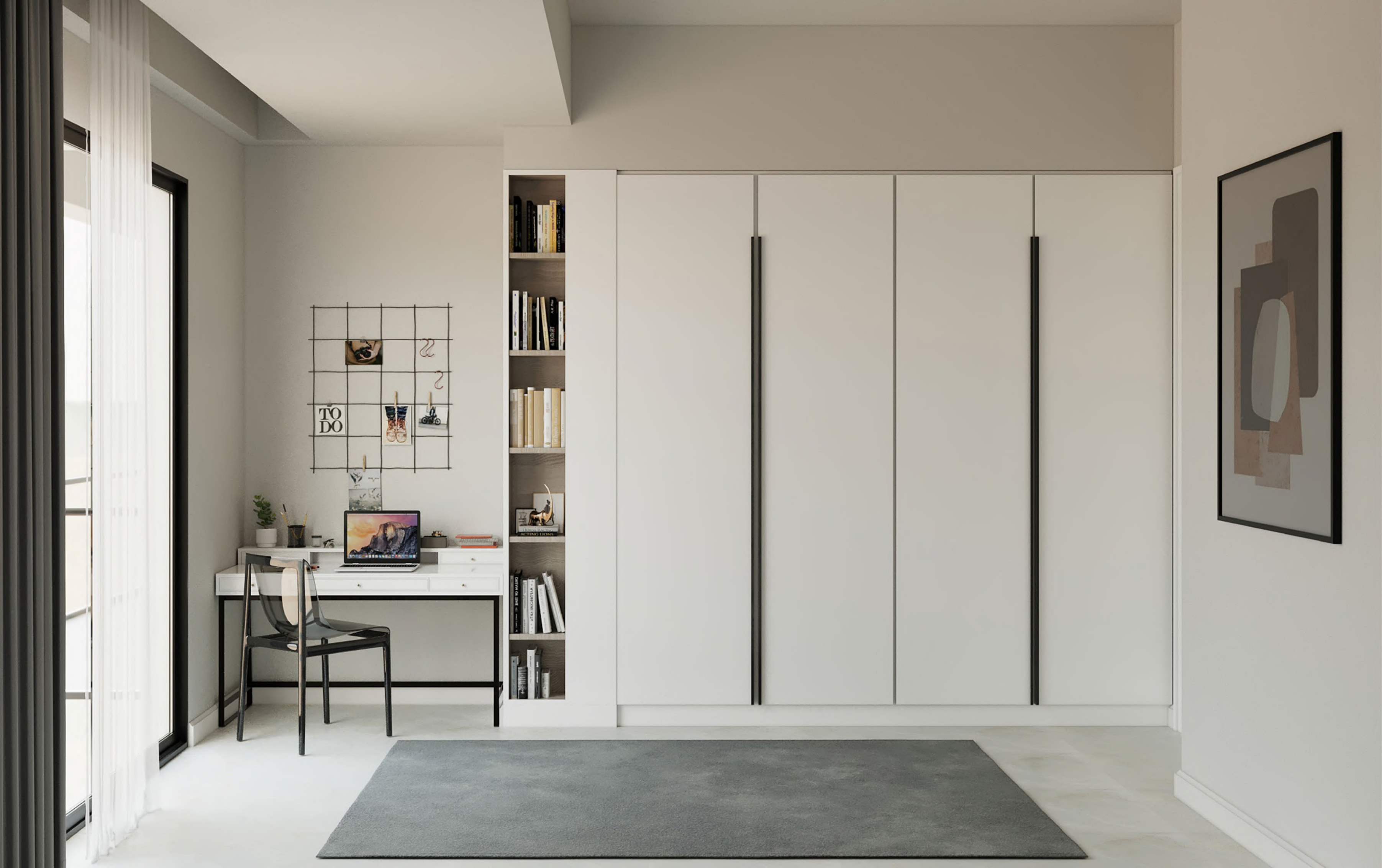
Çocuk Odası 1