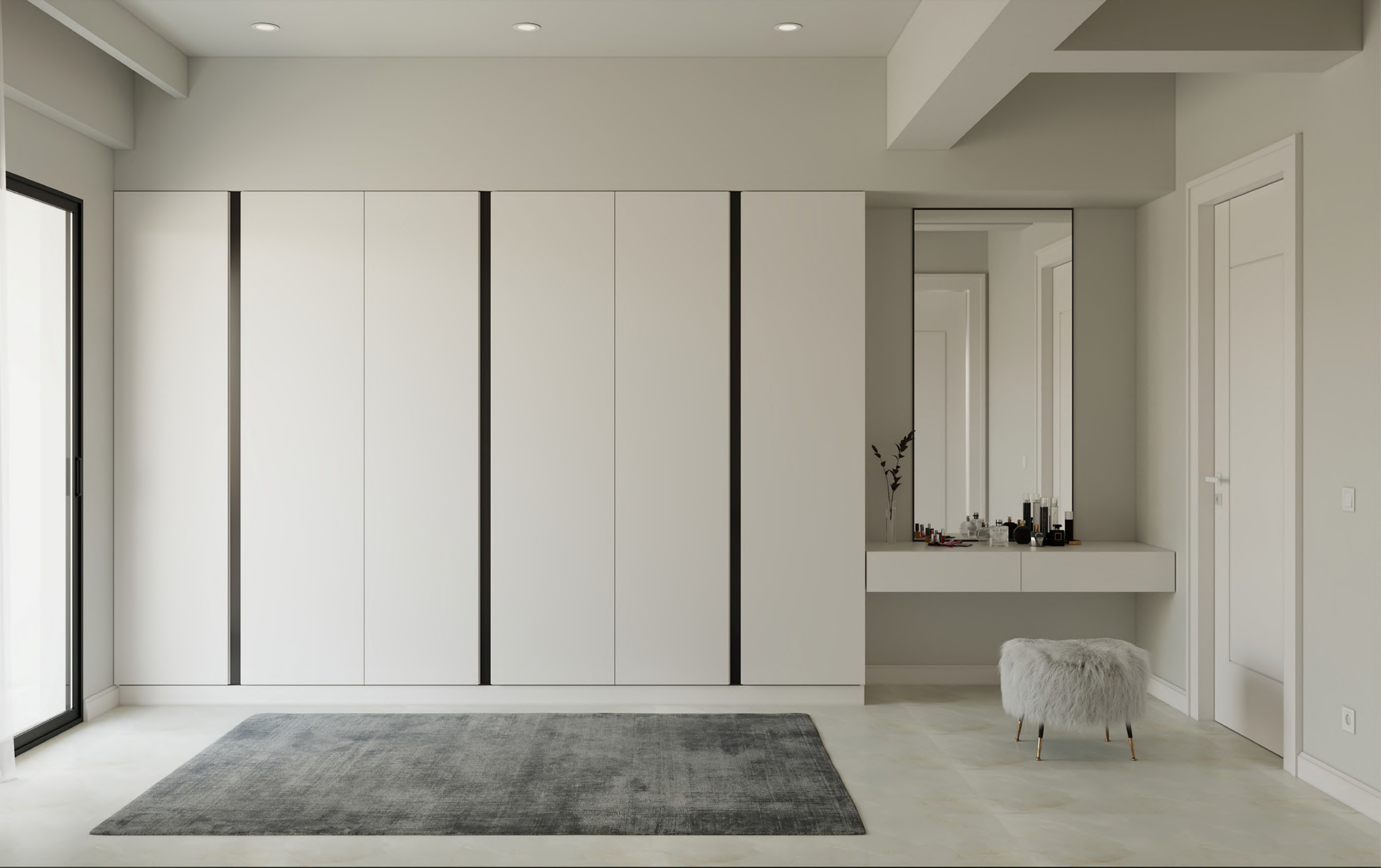
Ebeveyn Yatak Odası